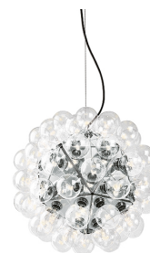
Taraxacum 88 S1 designed by Achille Castiglioni

Apparecchio di illuminazione a sospensione a luce diretta e riflessa.