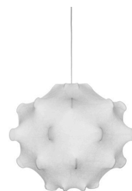
Taraxacum S1 designed by Achille & Pier Giacomo Castiglioni