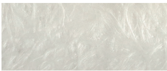
vetroresina naturale natural fiberglass

43 x 40 h45 cm - 16 3 / 4 x 15 1 / 2 h17 1 / 2 "