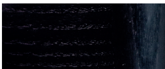
frassino tinto wengè wengè-stained ash