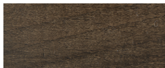
noce canaletto lucido glossy canaletto walnut