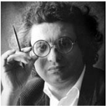
› Mario Botta