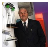
› Ernesto Gismondi